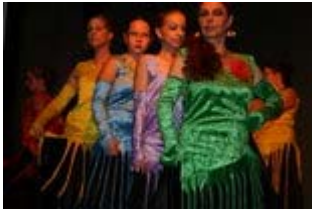
Die Jeannies luden jetzt wieder zu ihrem fast schon traditionellen Bauchtanzfest ein.